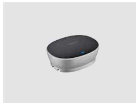
CONECTIVIDAD Y USO