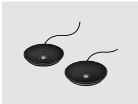
MICRÓFONOS DE EXPANSIÓN

El sistema de videoconferencia asombrosamente asequible para salas de reuniones medianas y grandes, permite que cualquier punto de encuentro sea un espacio de colaboración por vídeo.