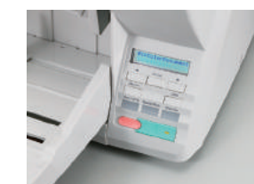
Panel de Control Intuitivo

Mediante el panel de control intuitivo del escáner DR-X10C, usted puede seleccionar botones programables y previamente registrados para "Escanear hacia Trabajos", verificar mensajes desplegados y seleccionar las fijaciones del escáner. La bandeja de alimentación se abre automáticamente al activarse el escáner. El escáner DR-X10C también cuenta con un diseño ergonómico, compacto y de peso liviano lo que agrega comodidad de manejo al operador. También incluye rodillos de alimentación reemplazables por el usuario para un fácil mantenimiento.