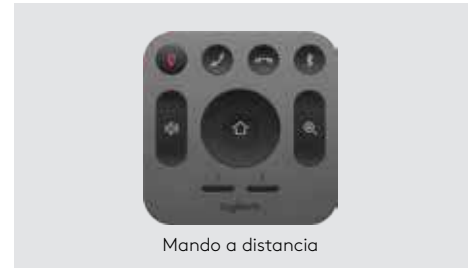
Mando a distancia