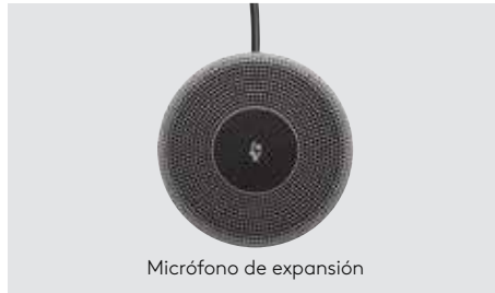
Micrófono de expansión